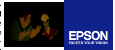
EPSON VENEZUELA PATROCINANTE DEL PROGRAMA CULTURAL FOTOGRAMA

En la sede del Centro de Formación Empresarial para Infantes y Jóvenes de San Joaquín; en el estado Carabobo, el lunes 07 de abril de 2008, se dio inicio al Programa Cultural FOTOGRAMA. Este programa es una iniciativa auto-gestionable que se encuentra bajo la Gerencia General de uno de los niños egresados del Primer Programa de Formación Empresarial. Toda la comunidad en general se beneficia de esta actividad recreativa y representa una alternativa sana, solidaria y cultural para las personas de escasos recursos.