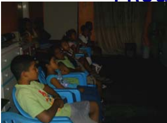
LUNES DE CINE

En la sede del Centro de Formación Empresarial para Infantes y Jóvenes de San Joaquín; en el estado Carabobo, el lunes 07 de abril de 2008, se dio inicio al Programa Cultural FOTOGRAMA. Este programa es una iniciativa auto-gestionable que se encuentra bajo la Gerencia General de uno de los niños egresados del Primer Programa de Formación Empresarial. Toda la comunidad en general se beneficia de esta actividad recreativa y representa una alternativa sana, solidaria y cultural para las personas de escasos recursos.